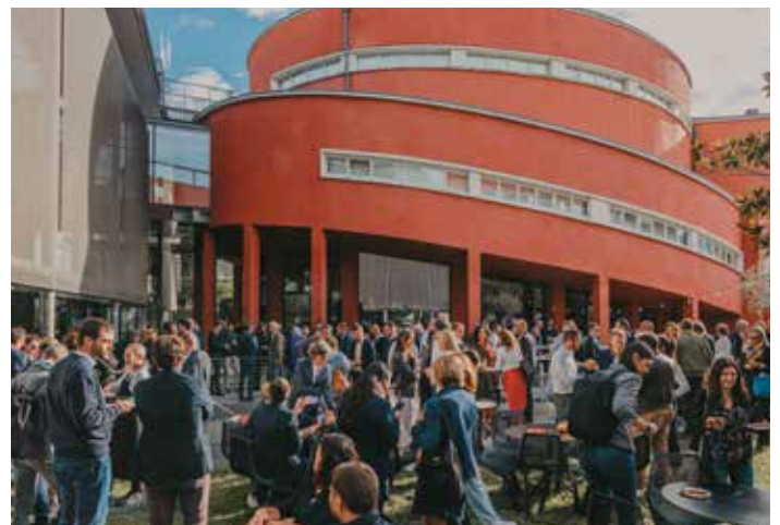
Im Garten von Eurac Research vertieften die Teilnehmenden das soeben Gehörte.