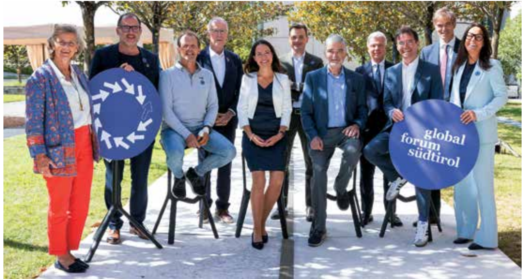
Die 16. Auflage von Global Forum Südtirol – auf dem Bild im Garten der Eurac – wurde wieder zu einem vollen Erfolg. Alle 4 Referenten (vorne sitzend) und einige Teilnehmer stellten sich dem Fotografen.

täglichen Entscheidungen würden aus dem Bauch getroffen und 100 Prozent der Forscher sagten, dass sie aus der Intuition heraus gearbeitet bzw. geforscht hätten. Die Intuition sei immer „leise“, sie halte sich stets zurück und befehle nicht.